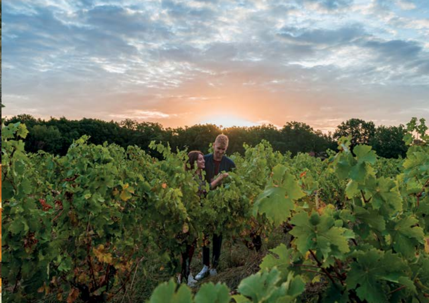
Vignoble de Fronton