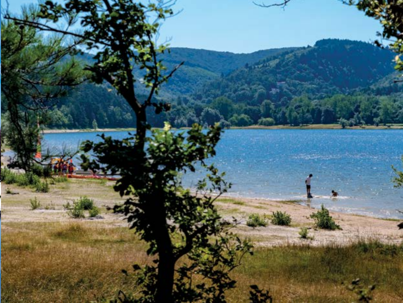
Lac de Saint-Ferréol à Revel