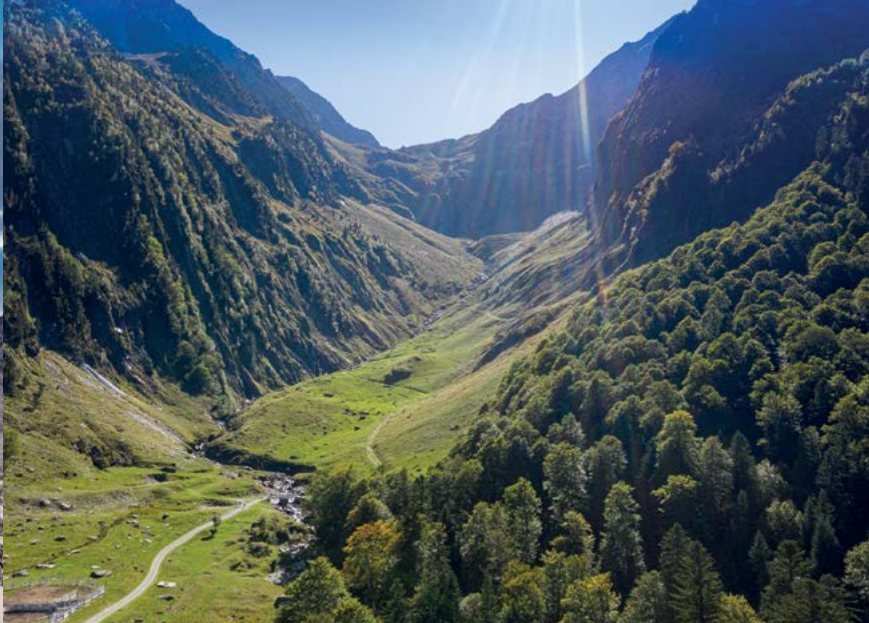
Hospice de France