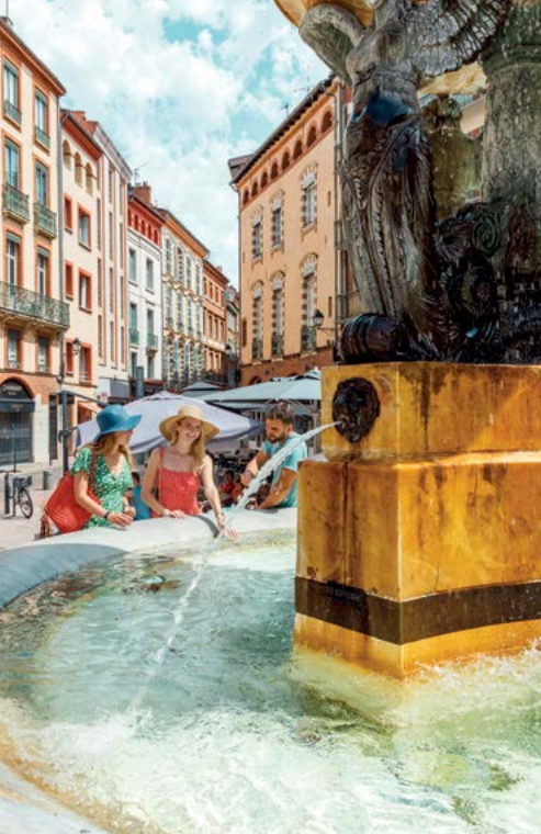
Place de la Trinité à Toulouse